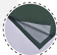
COSTADO CON BROCHES PLÁSTICOS

Safesatis , Su diseño presenta alta preocupación de detalles y comodidad, en tus largas jornadas laborales, entregando la mejor combinación de entre calidad y confort.