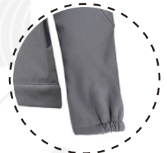
PUÑO DE MANGA AJUSTADO