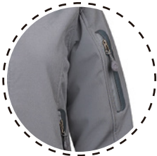
BOLSILLO EN BRAZO